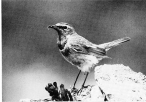
FIGURA 2. Pettazzurro orientale recante l'imbeccata.