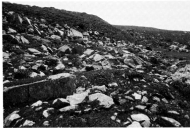
FIGURA 3. Ambiente di nidificazione del Pettazzurro orientale sulle Alpi lombarde.

La nidificazione accertata nel 1983 sulle Alpi franco-piemontesi non è stata confermata nei successivi controlli (Giannatelli e Boano in stampa e com. pers.). Vista l'importanza biogeografica del ritrovamento e l'esiguità della popolazione, si auspica che la zona non venga disturbata per esclusivi motivi fotografici.